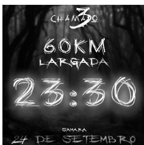
LOCAL: POSTO ASTRA