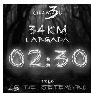
LOCAL: PONTO DE ÔNIBUS DO ESTREITO